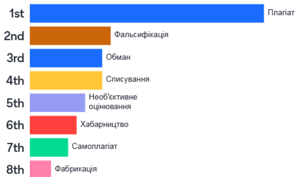
Рис. 1. Порушення принципів академічної доброчесності (загальна відповідь)