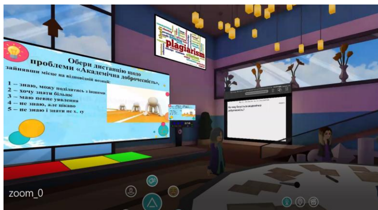
Рис. 3. Віртуальний простір AltspaceVR «Educational quest game «Академічна доброчесність: проблеми реалізації та відповідальність»