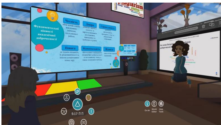
Рис. 4. Фрагмент заходу AltSpaceVR «Educational quest game «Академічна доброчесність: проблеми реалізації та відповідальність»

З початком епідемії коронавірусу освіта перейшла до дистанційного режиму, змусивши викладачів і здобувачів освіти поринути у світ прикладних програм і віртуальної реальності. Соціальна платформа AltSpaceVR є безкоштовною, має привабливий інтерфейс і функції, максимально пристосована для проведення освітніх заходів (Сипченко, 2021, с. 174). Програма надає достатній вибір дизайнів аудиторій і кімнат, а також простору, котрий можна доопрацювати, оформлюючи під тематику заходу, потреби та вподобання користувачів.