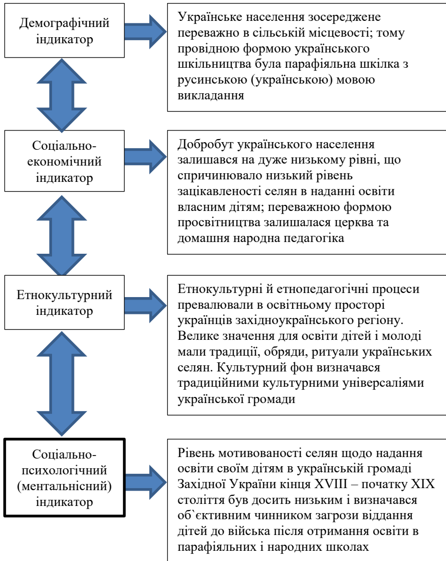
Рис. 1. Точково-фрагментарна модель