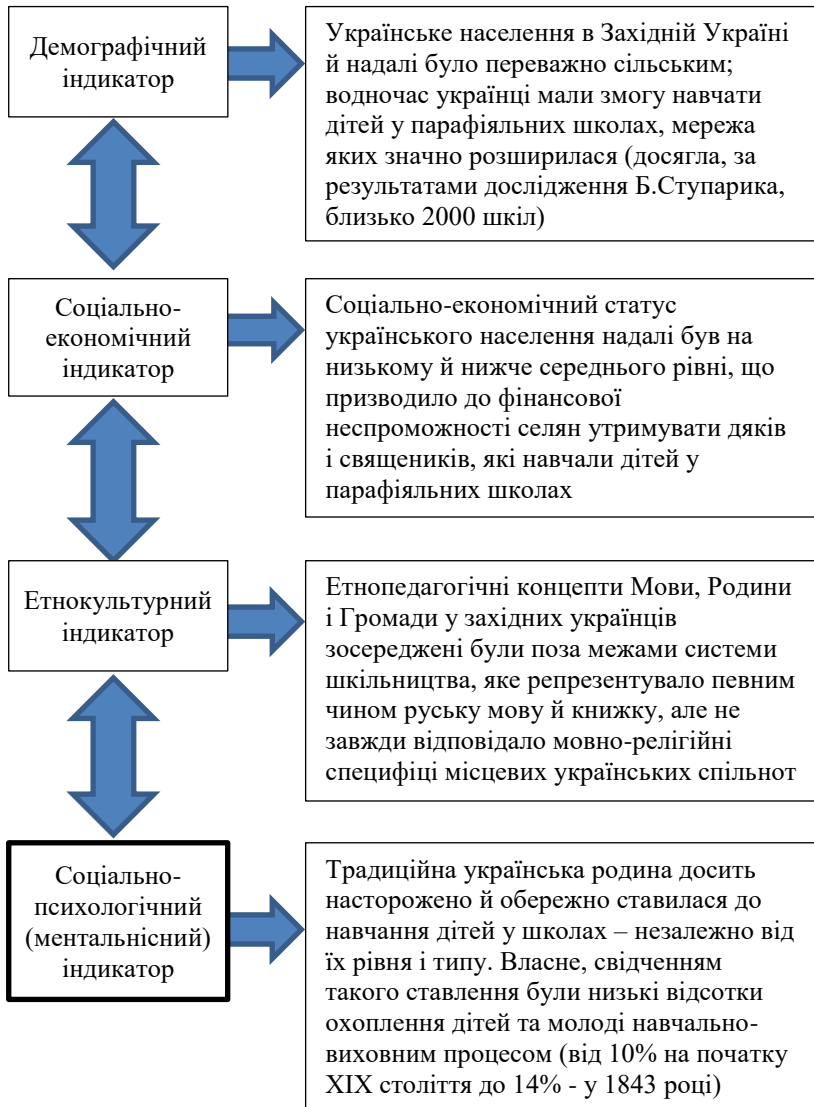
Рис. 2. Лінійно-фрагментарна модель

Ступенево-фрагментарна модель (див. рис. 3). Початок XX століття не приніс суттєвих змістових змін в розвитку україномовної освіти в