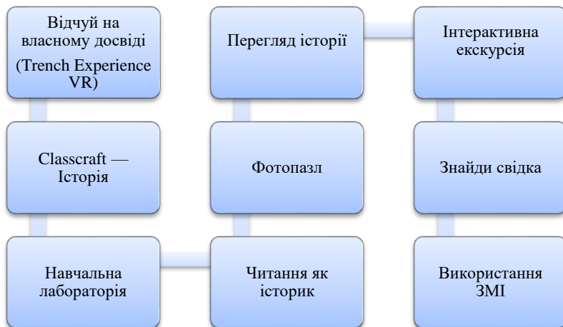
Рис. 1. Інновації у викладанні історичного матеріалу учням з особливими освітніми потребами

Для учнів з особливими освітніми потребами зміст історії як навчальної дисципліни є центром і ядром курсів мистецтва та суспільних наук у школах. Для означеної категорії учнів історія забезпечує суттєвий внесок у всю систему шкільної освіти, виявляючи зв'язок між людьми та різними галузями знань та їхнє значення для окремих осіб і суспільства в міру їхнього розвитку та взаємодії. Історія людства служить полотном для пізнання мистецтва, представляючи повну картину соціального, морального та комунікативного досвіду людей. Своєю історико-логічною діалектикою методи історичного пізнання мають і загальноосвітнє значення, тому повинні бути підібрані вдало. Пропонуємо розглянути деякі інновації у викладанні історичного матеріалу учням з особливими освітніми потребами (рис. 1).