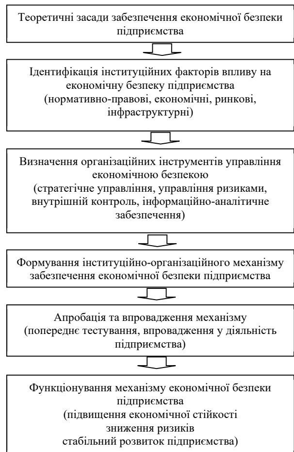
Рис. 1. Формування інституційно-організаційного механізму забезпечення економічної безпеки підприємства

інституційних факторів, які впливають на економічну безпеку підприємства. До таких факторів належать нормативно-правові умови ведення господарської діяльності, економічна та податкова політика держави, конкурентне середовище, стан інфраструктури, а також корупційні ризики, що можуть впливати на ефективність функціонування підприємств.