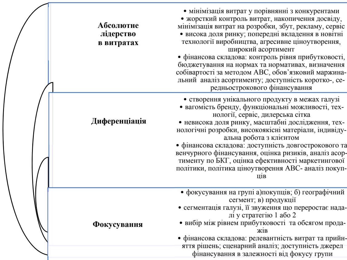
Рис. 1. Фінансова складова підприємства в залежності від його загального стратегічного підходу